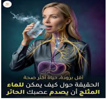
أقل برودة، حياة أكثر صحة الحقيقة حول كيف يمكن للماء الثلج أن يصدم عصبك الحائر

في تبريد الجسم بشكل آمن . ومع ذلك ينصح دائما بتناول الماء بدرجة حرارة معتدلة، وتجنب شرب الماء الثلج مباشرة بعد الأكل، أو على معدة فارغة، وأوصت الدكتورة نعمة زدام في ختام حديثها، بممارسة الرياضة، وتناول الماء البارد المعتدل غير الثلج، مؤكدة أن الماء هو أساس الحياة، لكن طريقة شربه لا تقل أهمية عن كميته، مع الحفاظ على درجة حرارة معتدلة للماء. وعدت ذلك أكثر أمانا للجسم، خاصة على المدى الطويل، مضيفة: "في المرة القادمة التي تمسك فيها بكوب ماء مثلج، ففكر مرتين قبل أن تتناوله دفعة واحدة"