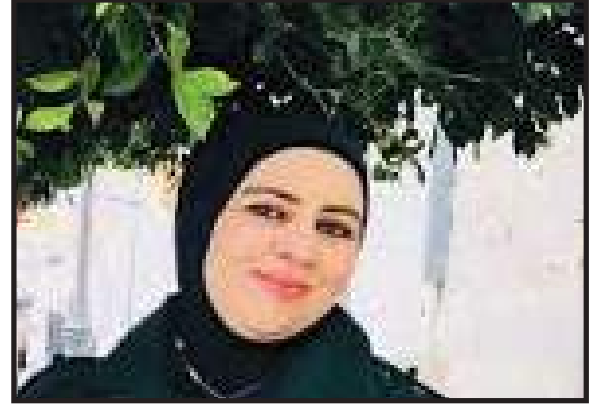
● بقلم: غدير حميدان الزبون - فلسطين