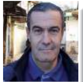
بقلم: الأستاذ محمد الصادق مقراني باحث ومهتم بالتاريخ المحلي لميلة

تزخر ولاية ميلة برصيد علمي وفكري وكان لعلمائها المنتميين إلى جمعية العلماء المسلمين الجزائريين دور بارز في حفظ الهوية ونشر العلم ومقاومة مظاهر الجهل ومحاربة البدع والحفاظ على الهوية الثقافية والشكرية غير أن صفحات كبيرة من تاريخ هؤلاء الأعلام ظلت حبيسة النسيان ولم تتل حقا من التوثيق والإنصاف.