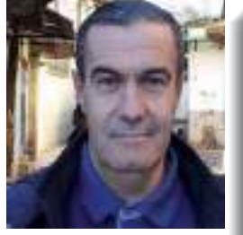
بقلم: الأستاذ محمد الصادق مقراني باحث ومهتم بالتاريخ المحلي لميلة

تزخر ولاية ميلة برصيد علمي وفكري وكان لعلمائها المنتميين إلى جمعية العلماء المسلمين الجزائريين دور بارز في حفظ الهوية ونشر العلم ومقاومة مظاهر الجهل ومحاربة البدع والحفاظ على الهوية الثقافية والشكرية غير أن صفحات كبيرة من تاريخ هؤلاء الأعلام ظلت حبيسة النسيان ولم تنل حقا من التوثيق والإنصاف.