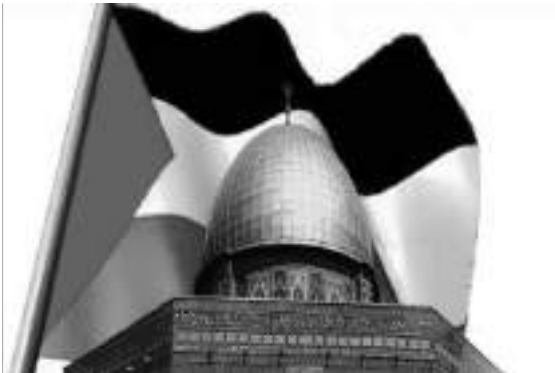
القدس، يعرض لي رمز تعبيري للعلم الفلسطيني.

خلال نهاية الأسبوع، تعهدت شركة آبل وقف الاقتراح التلقائي لدى بعض مستخدمي هاتف آيفون لرمز تعبيري يمثل العلم الفلسطيني عندما كتابة كلمة "القدس" في تطبيقاتها للرسائل النصية. وأعدت شركة التكنولوجيا العملاقة الأمر إلى خطأ برمجي بعد اتهامها بالتحيز ضد إسرائيل وسط الحرب المستمرة في غزة. وقالت آبل إن الرمز التعبيري المقترح في لوحة مفاتيح آيفون عند كتابة رسالة ليس مقصودا، مشيرة إلى أنه سيتم إصلاحه في التحديث التالي لنظام تشغيل الهاتف "أي أو إس". وأضافت أن "عندما أكتب عاصمة إسرائيل،