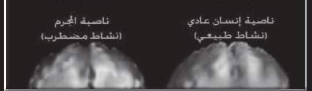
ناصية إنسان عادي (نشاط طبيعي) ناصية المجرم (نشاط مضطرب)

في دراسة حديثة لأدمغة عدد من المجرمين تبين وجود اضطراب دائم في منطقة الناصية ولذلك يعتبر العلماء المنطقة الأمامية من الدماغ (الناصية) مسؤولة عن الجريمة. وبحاول العلماء اليوم استغلال هذا الأمر كدليل قانوني للكشف عن المجرمين حيث وجد العلماء أن ارتكاب الجريمة يؤدي إلى تلف أجزاء من خلايا الناصية وتعطل عملها ولذلك يأخذ الله بهذه النواصي يوم القيامة إلى جهنم.. وهكذا يكون القرآن أول كتاب يشير إلى علاقة الجريمة بالناصية قال تعالى عن المجرمين: (يُعْرَفُ الْمُجْرِمُونَ بِسِيمَاهُمْ فَيُؤْخَذُ بِالنَّوَاصِي وَالْأَفْئَامِ) [الرحمن: 41]. بالله عليكم ألا تشهد هذه الحقيقة الدامغة على إعجاز القرآن!!!