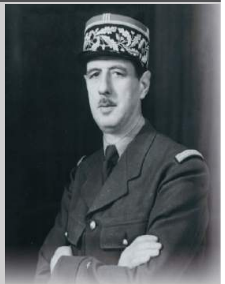
جمعها / خليل وحشي

هناك وأنتم هنا»، غير أن الباي رفض المشروع بقوله: «أنا جزائري ينالني ما ينال باقي الجزائريين....». وبذلك خيب» الحاج أخاموك» ظنون فرنسا، ولم تفلح مع وطنيته الإغراءات التي قدمتها فرنسا له، ومن المناورات التي قام بها «ديغول» من أجل إقناع الرأي العام الداخلي والخارجي، احتفاظ فرنسا بالصحراء الجزائرية هو من أجل جعل حد الأطماع البلدان المغاربية والإفريقية المحادية للصحراء الجزائرية، فالمغرب يرى أن حدوده تمتد من منطقة «فقيق إلى المحيط الأطلسي، وأن منطقة بشار، تندوف ورقان ليست أراضي جزائرية، أما تونس فمطلبها هو اقتطاع جزء من العرق الشرقي الكبير، والاستفادة من البترول الواقع في باطن الحدود الصحراوية الجزائرية، ومنذ سنة 1959 بدأت ليبيا تتطلع إلى توسيع مساحتها على حساب الصحراء الجزائرية بتوغلها نحو سلسلة طاسيلي ناجر، أما المالي فإن زعيمها «مدايري كايثا» كان صريحا في خطاب ألقاه ب كيدال في 21 أكتوبر 1959 حيث قال: «الصحراء ليست أرض فرنسية، وإنما هي ملك للأفارقة سواء كانوا بيض أو سود ولعل هذه الرغبة التوسعية لدى البلدان المجاورة للجزائر تدخل في إطار مناورة فرنسية تسعى من ورائها إلى تحقيق هدفين فالأول هو إشارة الطمع والرغبة في