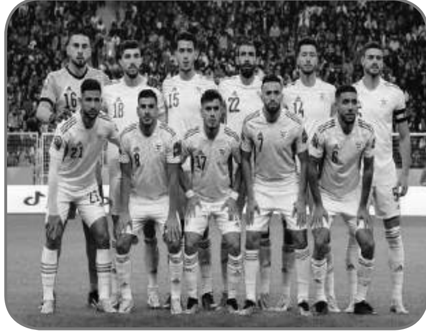
ليبيبا 0. لمعب براقبي، موزمبيق - الجزائر / المقابلات المتبقية: الجولة الثالثة (السبت 21 يناير 2023)؛ لمعب عنابة، ليبيبا - إثيوبيا (20/00)