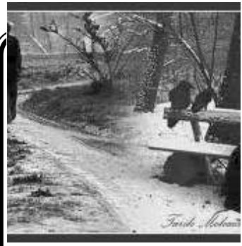
أما أنه يتوجب على كل واحد أن يتدارك نفسه ويرى مستقبله.

الإنسان اجتماعي بطبعه وحياته تكون ضمن نطاق الجماعة يتفاعل معها ويتبادل المنافع والسعادة معها، التحقيق حاجاته الفطرية الأساسية من الشعور بالحب والتقبل والانتماء والاندماج مع الجماعة، إلا أن بعض الأفراد يميلون إلى الانطواء على أنفسهم إلى حد العزلة والوحدة وهي تعتبر مشكلة نفسية لها آثارها الاجتماعية. الانطواء على الذات هو الميل إلى العزلة والإنفراد وعدم الرغبة في مشاركة الآخرين العمل والنشاط واللعب الجماعي، كما