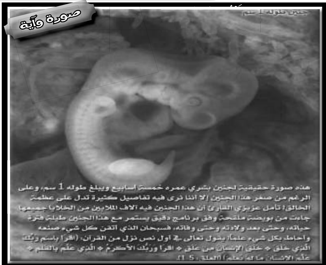
هذه صورة حقيقية لجنين بشري عمره خمسة أسابيع ويبلغ طوله 1 سم، وعلى الرغم من صغر هذا الجنين إلا أننا نرى فيه تفاصيل كثيرة تدل على عظمة الخالق! تأمل عزيزي القارئ أن هذا الجنين فيه آلاف الملايين من الخلايا جميعها جاءت من بويضة ملصقة وفق برنامج دقيق يستمر مع هذا الجنين طيلة فترة حياته، وحتى بعد ولادته وحتى وفاته، فسبحان الذي اتفن بكل شيء صنعه واحمده بكل شيء علمه! يقول تعالى في أول نزل من القرآن: (اقرأ باسم ربك الذي خلق - خلق الإنسان من علق - اقرأ وربك الأكرم - الذي علم بالقلم - علم الإنسان ما لم يعلم) العلق، 1-5.

رب اشرح لي صدري، ويسر لي أمري، واحلل عقدة من لساني يفقهوا قولي، بسم الله الفتاح، اللهم لا سهل إلا ما جعلته سهلاً وأنت تجعل الحزن مني شتاً سهلاً يا أرحم الراحمين.